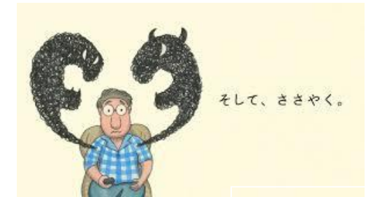
日本赤十字社作成