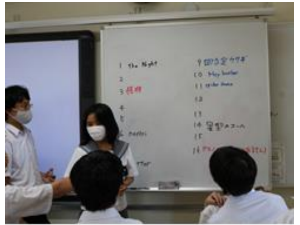
休み時間にもレクの準備をしています。