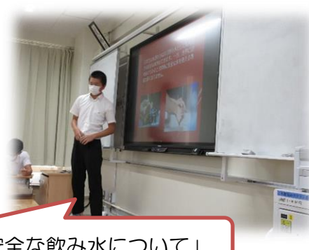
「安全な飲み水について」