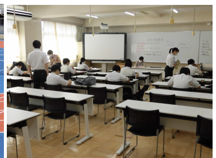
【夏期学習教室】学習支援ボランティア

文京区立第八中学校ウェブページ Web アドレス： https://www.bunkyo-kyo.ed.jp/daihati-jh/