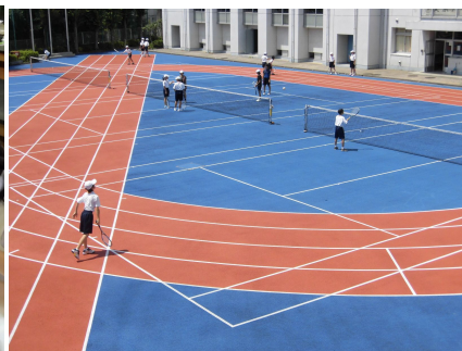
【ソフトテニス部】九中との交流試合