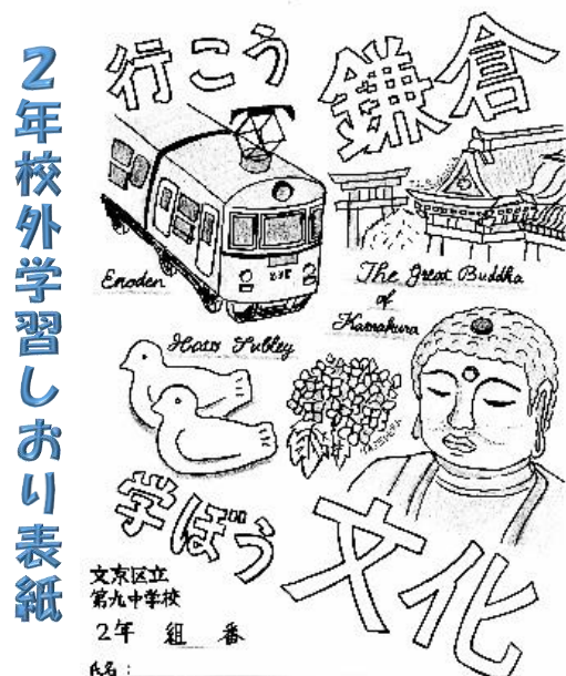
2年アート部の皆さん