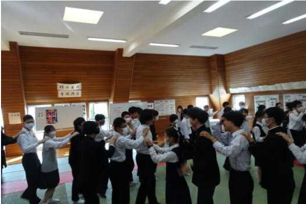
4月17日(水) 3年生学年朝会 (レク)