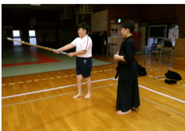
4月18日(木) 1年生体験入部