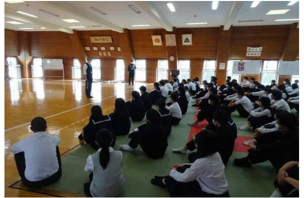
4月17日(水) 3年生学年朝会