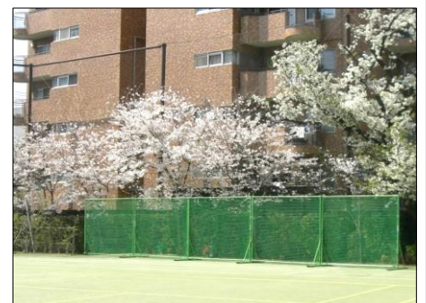
校庭の桜もきれいに咲きました！