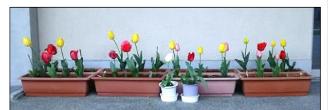
ボランティア部の皆さんが 育ててくれたチューリップ