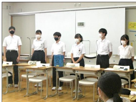
生徒会・委員会活動 白熱の議論