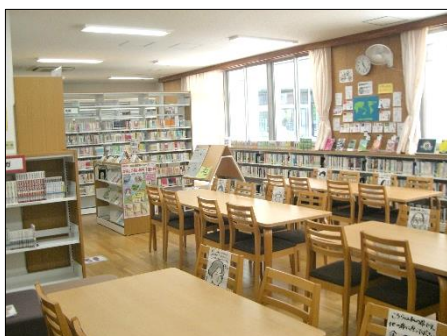
落ち着いた雰囲気図書室