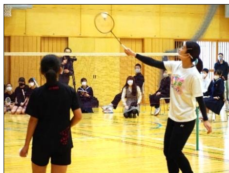
令和2年度「健康講話」高橋 礼華 さん 2016 リオ五輪 バドミントン<金>