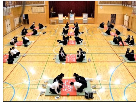
百人一首大会 文の京ならではの行事