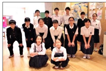
美 術 部