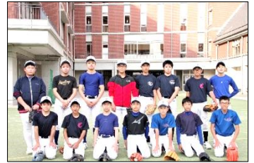
野 球 部 (男子)