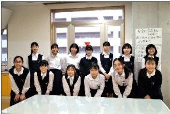
手 芸 部 (女子)