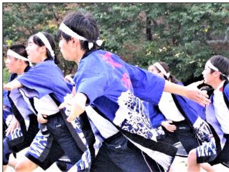
運動会 伝統の「全校ソーラン」