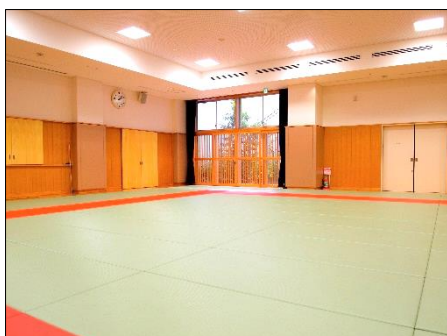
地下1階格技室（畳は収納式）