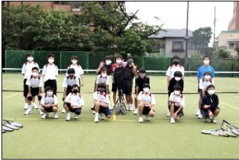
ソフトテニス部 (男子)