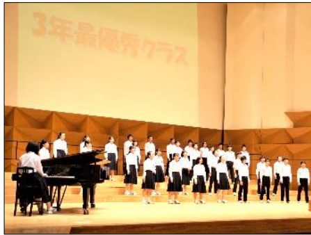
学習発表会 レベルの高い合唱