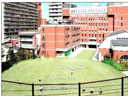
人工芝の緑が鮮やかな校庭