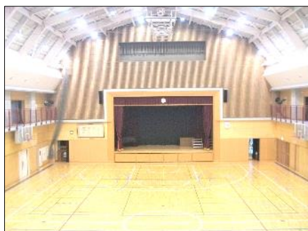
冷暖房完備でスケールの大きなアリーナ