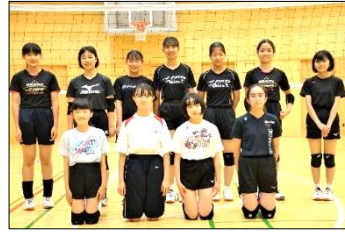
バレーボール部 (女子)