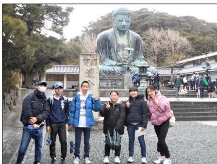
2年鎌倉校外学習 自主・自立の班行動