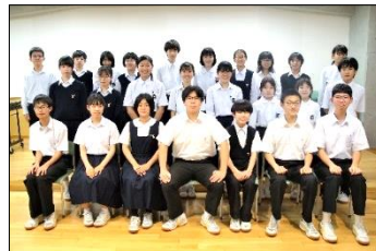
吹 奏 楽 部