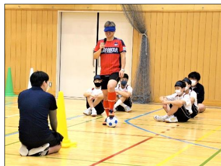
「ブラインドサッカー体験」 ＜毎年2年生で実施＞