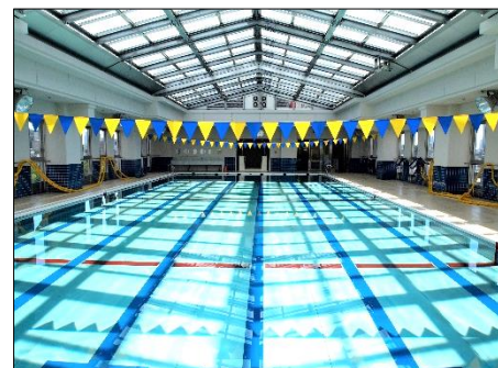
開閉式屋根を備える7階室内プール