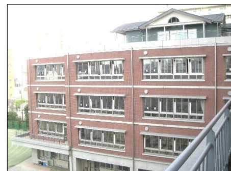
モダンな造りの普通教室棟と5階会議室