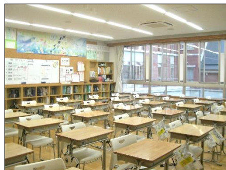
明るく開放感のある教室