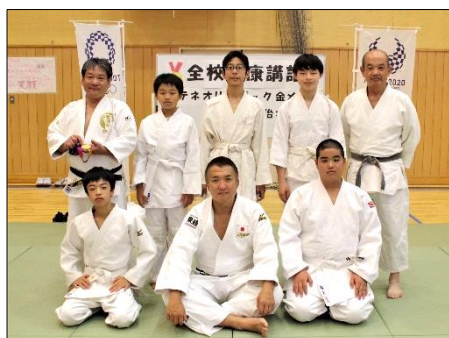
令和元年度「健康講話」鈴木 桂治 さん 2004 アテネ五輪 柔道<金>