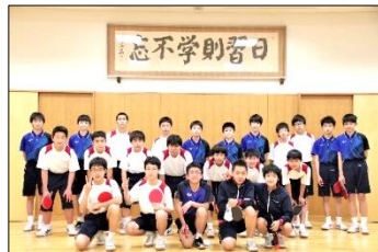
卓 球 部 (男子)