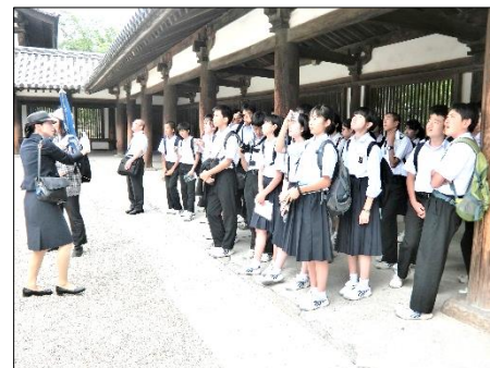
3年修学旅行 「規律ある自由」の集大成