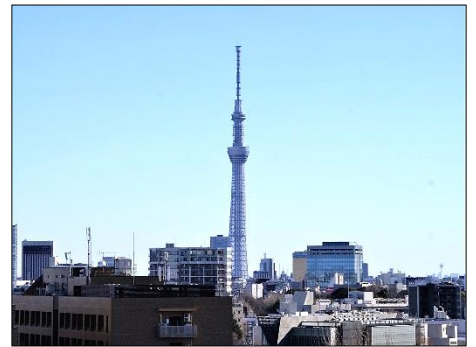
東／東京スカイツリー

保護者の皆様、六中生の皆さんにおかれましては、お健やかに佳き春をお迎えのことと存じます。令和3年度の締めくくりとともに、令和4年のスタートとなる3学期を迎えました。3年生にとっては、より大きくはばたくためのステージを、2年生にとっては、六中をけん引していく最高学年を、1年生にとっては、上を支え下を助ける中堅学年を迎えるための準備期間として、重要な意味をもつ3か月間となります。感染症の状況が気になることですが、それぞれが「自分のできることにしっかりと取り組む」ことが大事です。