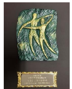
【左：表彰状／右：記念の盾】