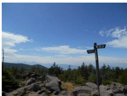
八ヶ岳高原学園（第1学年）9月5日～7日