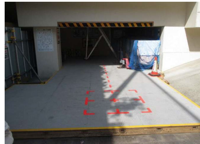
B1階常設区画内部に搬出入用構台を設置して、校庭からの荷を受ける。