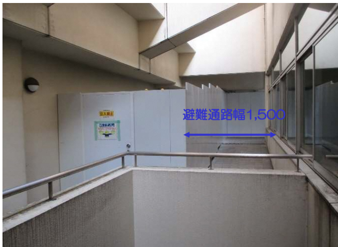
B1階外部に避難通路を確保した上で常設区画を設置し、施錠管理する。