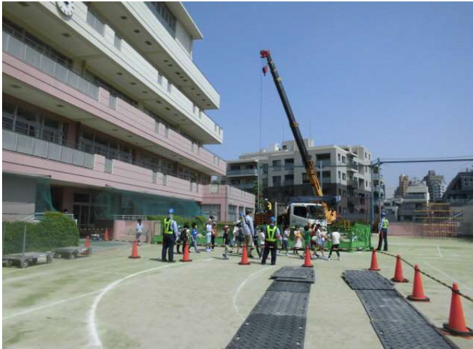
わんぱく広場開催中の校庭の区画及び誘導員配置による丁寧な誘導