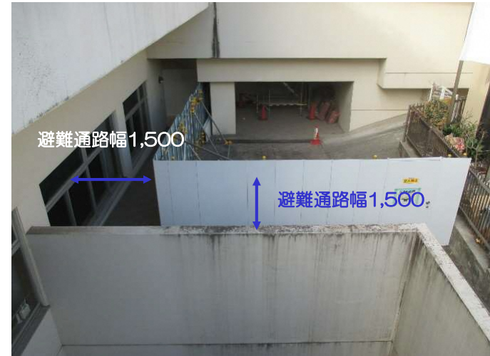
B1階外部に避難通路を確保した上で常設区画を設置し、施錠管理する。