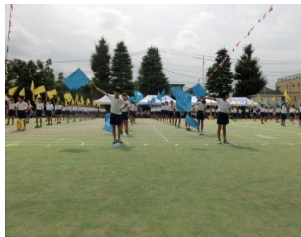
サウンド・オブ・フラッグ (3・4年生)