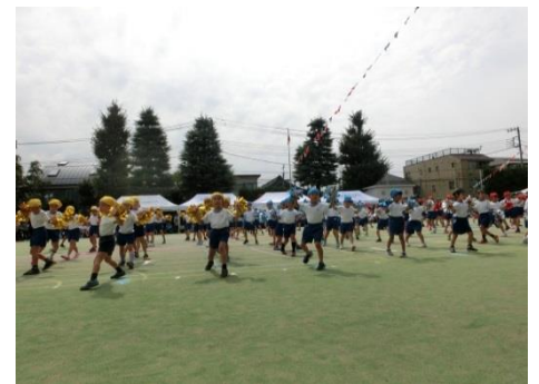
こびだい☆ぐつき～す (1・2年生)