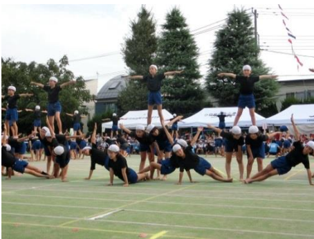
組体操～キセキ～ (5・6年生)