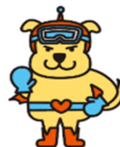
安全安心を推進するキャラクター みまもりいぬ

日時 2月20日（木）5・6校時 学校発 13:45 学校着 15:00 集合時刻 13:35 場所 玄関前