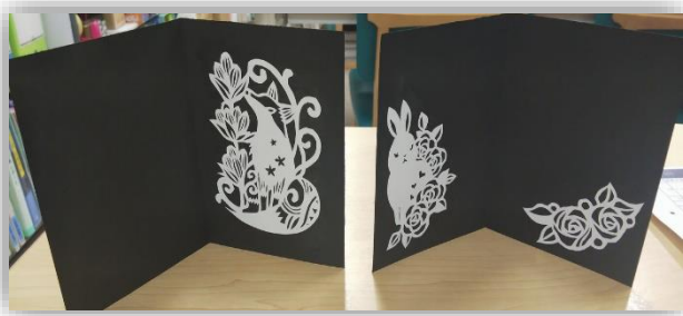
写真はカードの一例です。