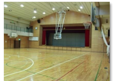
全館冷暖房完備(アリーナ含む)