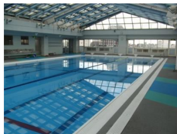
屋根開閉式の全天候対応プール