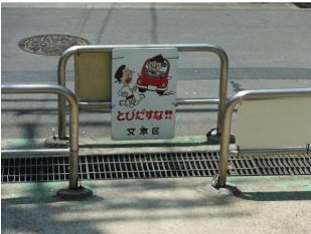
千石一丁目児童遊園 前