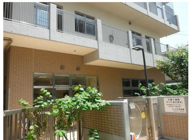
千石保育園・児童館・育成室