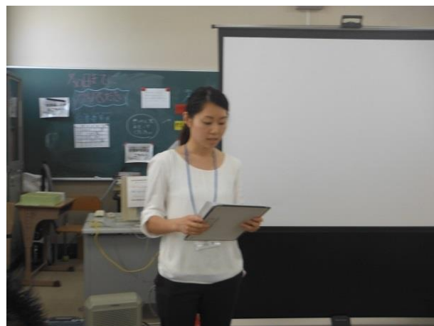
養護教諭より定期健康診断結果報告