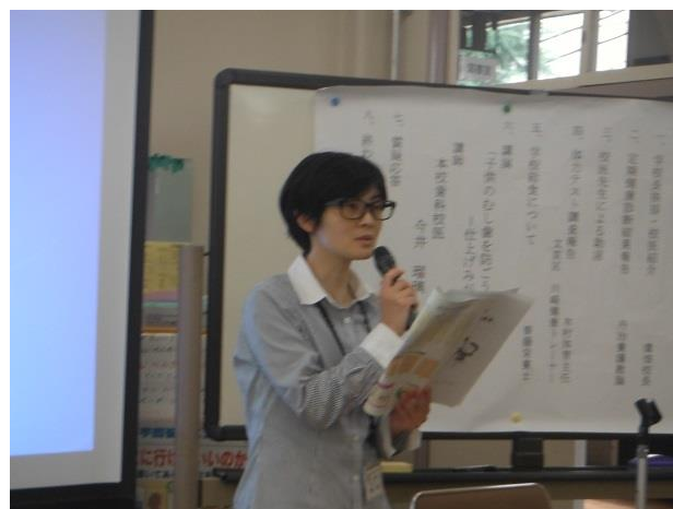
栄養士より学校給食の説明