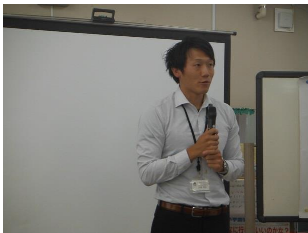
健康トレーナーより体力テスト結果考察