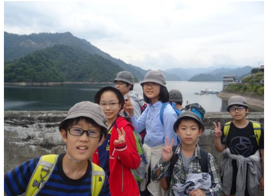
ダムでの1コマ！中は寒かった～