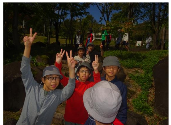
最終日も元気！！（目黒邸にて）