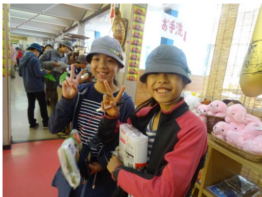
どれを買おうかな～