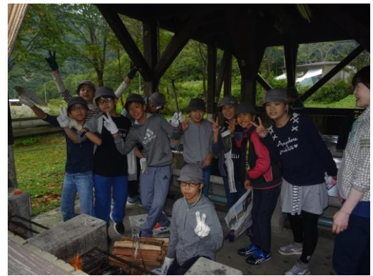
みんなで作ったカレーの味は忘れられません！