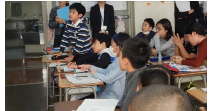
対話型授業の研究…研究授業7回、事前事後の自主研究授業11回