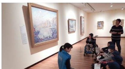
国立西洋美術館見学 アートコミュニケーター様のガイド