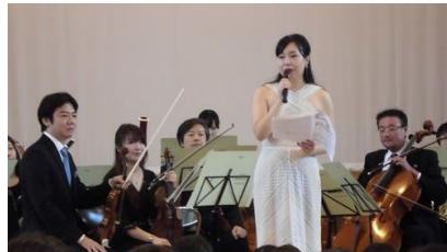
出張コンサート 東京フィルハーモニー交響楽団様