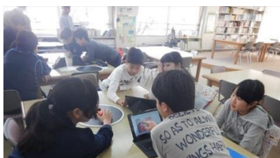
拓殖大学様のプロジェクトによる プログラミング体験学習

授業を行ってくださった方々へは、毎回必ず、子供たちがお礼の手紙を書きました。子供たちの文章には、学んだ嬉しさ、体験した喜びがあふれていました。