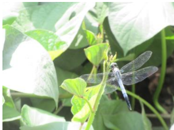
サツマイモ畑に トンボが来ました

幼稚園の植物や生き物たちも暑い夏を乗り越え、すくすく生長し、元気に過ごすことができました。生き物をご家庭で預かってくださった皆様、ありがとうございました。