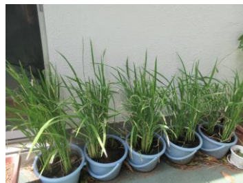
修了生の保護者の方から頂いたイネ 稲穂が付き始めました