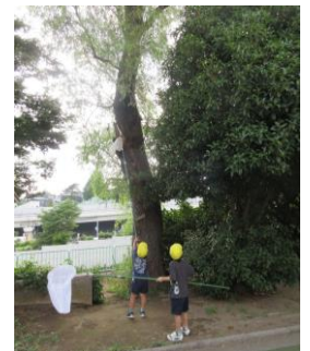
そーっと近付いて。。。 柳の木で虫取り