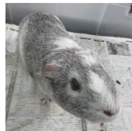
モルモットのふわもるくん エサをよく食べています

さて、今日から2学期が始まります。まだまだ暑い日が続いていますが、季節は少しずつ、確実に移り変わっています。身近な自然物の変化や風の心地よさなどを子どもたちが体感し、発見を楽しめるように関わっていきます。また2学期は、運動会や遠足、一日動物村、あおやぎ劇場など、様々な行事があります。日常の遊びや生活での経験を行事に生かし、行事での経験を遊びの充実につなげていきます。