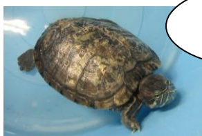
カメッピー カメキングも