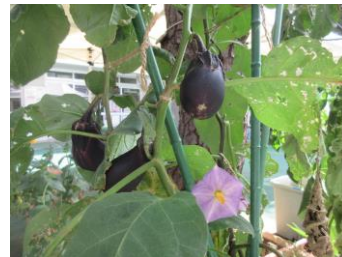
ナスの花 きれいに咲きました