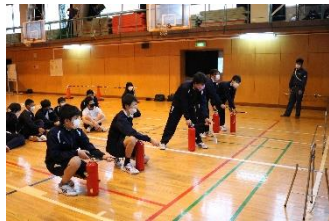
消火器による初期消火訓練