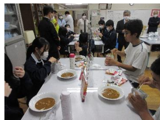
カレー、アルファ米、クラッカー(夕食)