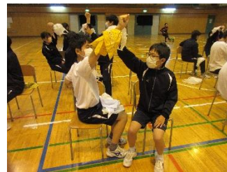
三角巾を用いた応急手当