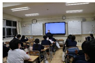
講話：「避難所で中学生ができること」など