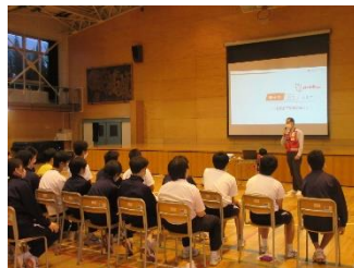
講演：首都直下地震への備え