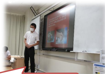
「安全な飲み水について」