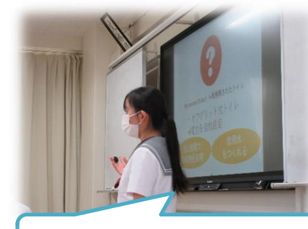
「世界のトイレ環境について」