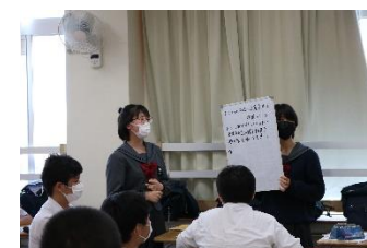
上のクイズの答えを発表している様子