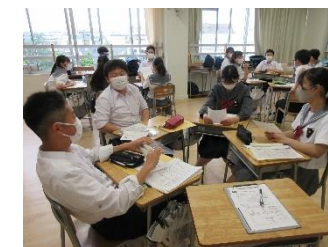
ロールプレイングの様子