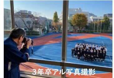
3年卒アル写真撮影

昭和23年(1948年)12月10日、国際連合第3回総会において、全ての人民と全ての国とが達成すべき共通の基準として、「世界人権宣言」が採択されました。