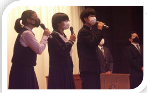
代表生徒の 校歌歌唱

離任式では、離任された先生方が入場する花道もなく、入退場の時だけ生徒が椅子を動かして花道を作る状況でした。離任式では、感染症対策のため校歌斉唱もできないので、壇上で代表生徒が歌唱し、他の生徒は心の中で歌う形をとりました。