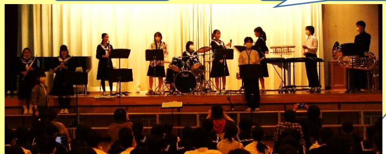
吹奏楽部ミニコンサート