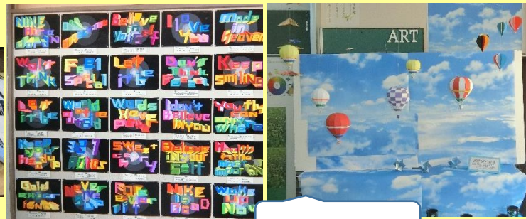
美術科・アート部