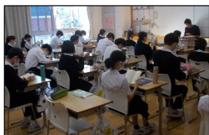
図書室のお薦め本コーナー

わずか10分程度であっても、毎日続ければ相当な読書時間になります。朝の教室では、生徒がそれぞれ読書に集中していて、そこから静かに学校生活が始まる。そんな風景が当たり前の日常となるように、朝読書を一層定着させていきましょう。