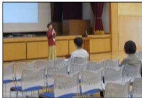
PTA 会長挨拶と個別相談会案内表示