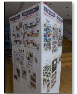
地域学校協働本部作成 学校紹介パネル