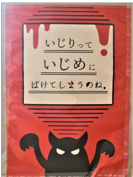
いじりって いじめにばけてしまうのね。

「いじめないで!」 じぶんのほっぺをつねってごらん つねってみた? どうだった? いたかった? それとおなじように、 おともだちもいたんだよ!