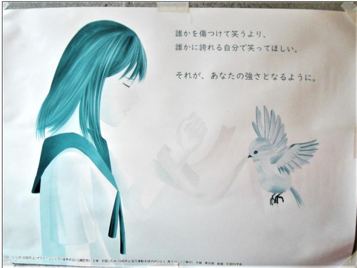
誰かを傷つけて笑うより、 誰かに誇れる自分で笑ってほしい。 それが、あなたの強さとなるように。