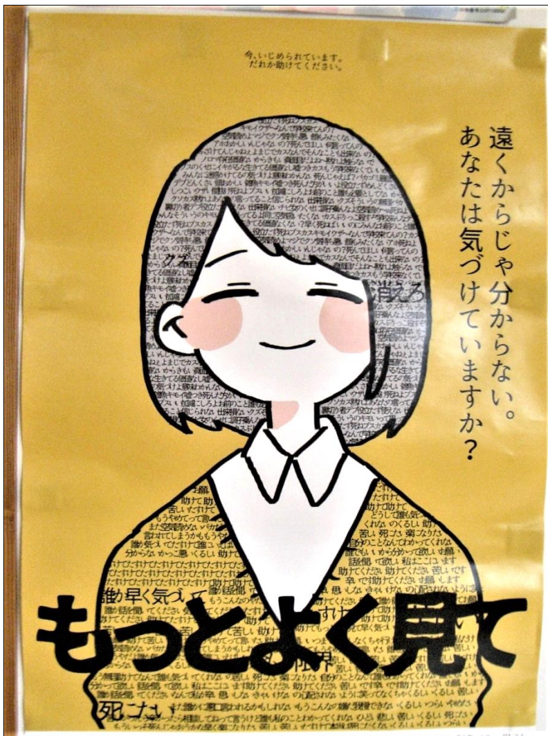
今、いじめられています。だれか助けてください。 「もっとよく見て」 遠くからじゃ分からない。あなたは気づけていますか？