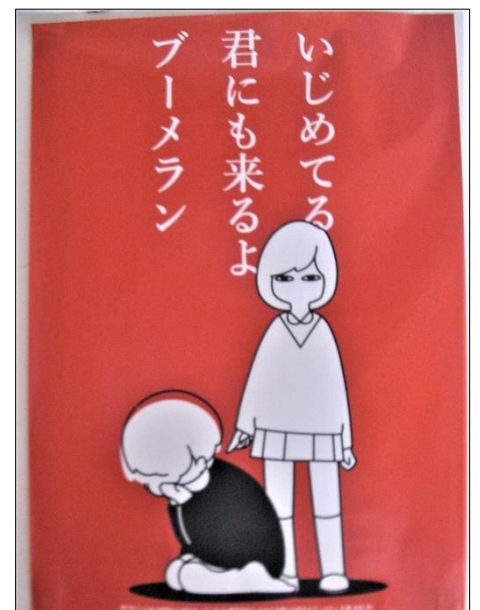
いじめてる 君にも来るよ ブーメラン