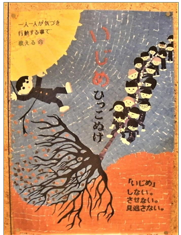
一人一人が気づき行動する事で救える命 「いじめ ひっこぬけ」 「いじめ」しない。させない。見逃さない。