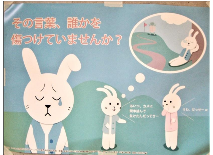
「あいつ、カメに競争挑んで負けたんだってさー」 「うわ、だっせーw」 その言葉、誰かを傷つけていませんか？