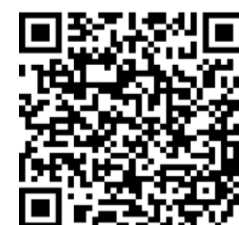
▲教育センター ホームページ