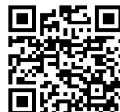
▲「教室・講座」 申込フォーム一覧

インターネットからPDFファイルでご覧いただいている場合、下記QRコードをタップまたはクリックすると、該当のサイトを開くことができます。