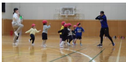
コーディネーショントレーニング

令和6年度の入園申し込み時期を迎えた今、「ひよこ広場」には「もうすぐ私もちゅうりっぷ組になるんだ」と来年度の入園を楽しみにして遊びに来てくれているお子さんもいます。新しい出会いが一つ増えることを楽しみにしながら、もんちゃんが「ひよこ広場」でお待ちしています。