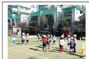
グーチョキパー鬼は、逃げる、追う、助けるなど、様々な動きが必要です。