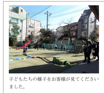
子どもたちの様子をお客様が見ていただきました。

園内環境マップを作成してみると、実に13種類の固定遊具（固定遊具を活用した遊具）と4種類の運動遊び、そして運動遊びに活用される幼児が持ち運んで遊べる遊具が37種類あることが分かりました。子どもたちは、それらを自在に自分たちの遊びに取り込みながら体を動かす経験を積み重ねてきました。自分なりに試しながら、遊具や遊びによって誘発される様々な体の動きを経験しています。一つの遊びに熱中する姿もあれば、たくさんの遊びを次々と試す姿もあります。どちらの姿も自ら取り組む意欲を支え、励まし、認め、一緒に喜びながら、体を動かして遊ぶ楽しさをたくさん味わうことができるような援助を積み重ねてきました。外遊びが好きな子どもたちが増えて、本園の教育目標「元気に遊ぶ子ども」が達成されるよう、引き続き指導援助の工夫をしてまいります。