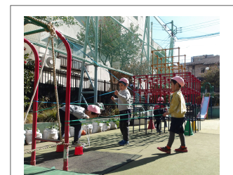
カラーゴム紐に触らないようにくぐる ことができるかな？