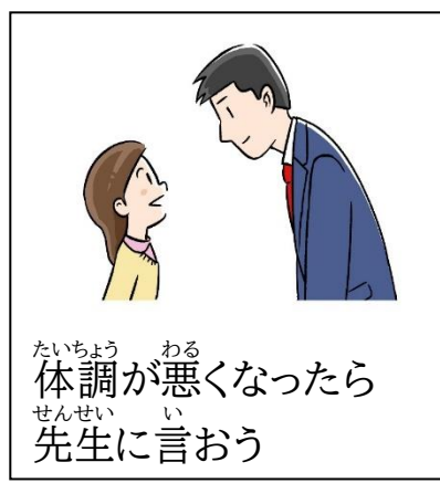
たいちよう わる 体調が悪くなったら せんせい い 先生に言おう