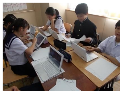
タブレットを活用した授業