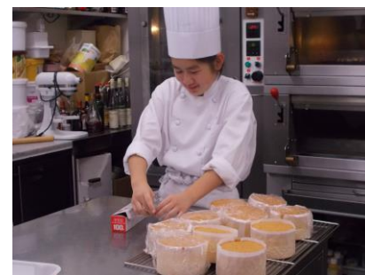
様々な事業所での職場体験