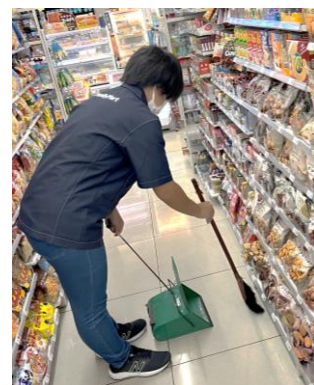
様々な事業所での職場体験