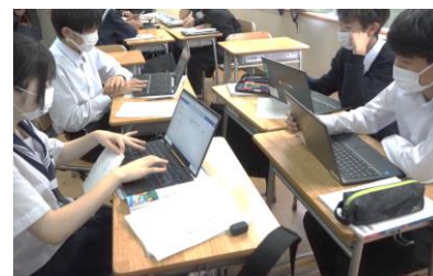
タブレット端末を活用した授業