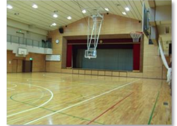
全館冷暖房完備（アリーナ含む）

文部科学省の推進する「学校施設のインテリジェント化」によって設計された校舎は、全館冷暖房を完備し、生徒は年間を通して快適な環境で、学習や部活動などに集中することができます。また最上階には屋根が開閉する全天候対応プール、また区内でも数少ないテニスコート全4面を有する、ゆとりのあるグラウンド、アリーナ（体育館）の他に格技室、和室などの多様な施設で、様々な学習活動に対応しています。