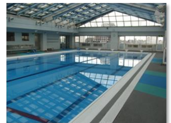
屋根開閉式の全天候対応プール

これからも歴史と伝統に培われた校風を大切にしつつ、充実した施設を活用した茗台中学校ならではの教育活動を保護者、地域の皆様と共に進めてまいります。