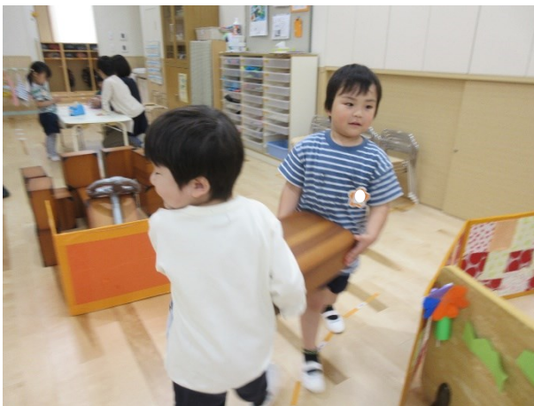
「とかげの乗り物です。」