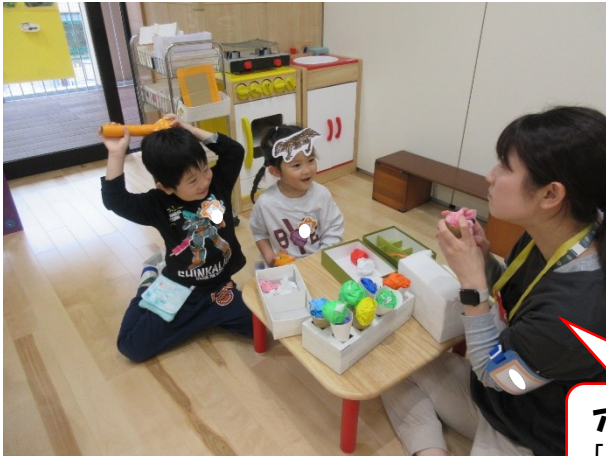
アイス屋さんごっこ 「おいしい！」