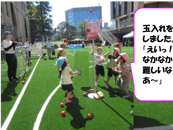
玉入れをしました。「えいっ! なかなか難しいなあ〜」