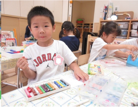
粘土や塗り絵で遊んでいます。