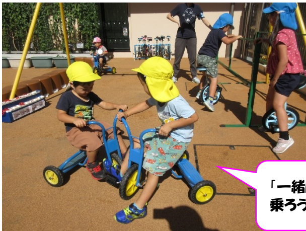
「一緒に三輪車に乗ろう」