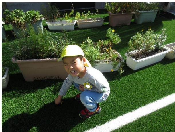
花びらを集めよう。「きれいな黄色だな」