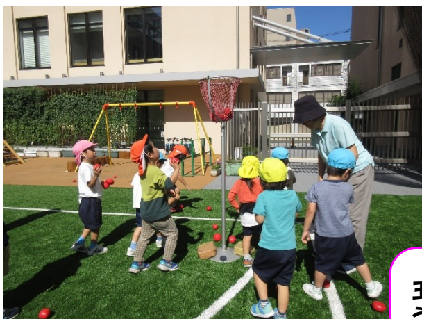
玉入れをやろう！ 「届かな〜」 「難しいね」