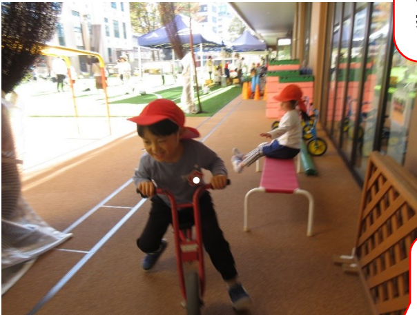
スクーターに乗っ たり基地を作った りしています。