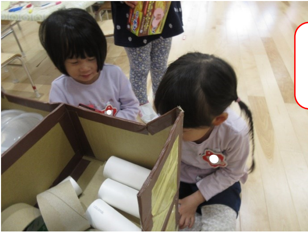
お店屋さんごっこ をしています。