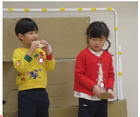
劇の練習をしました。