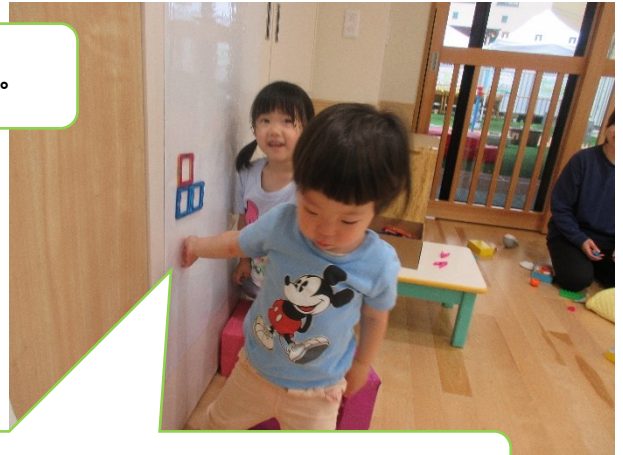
マグネットの四角を張り付けて遊んでいます。