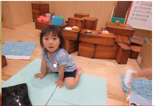
ままごとをしています。「ベッドでおやすみなさい。」