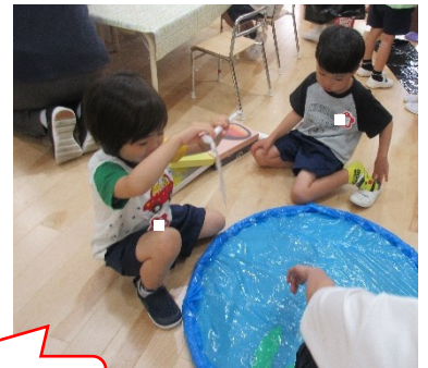
魚釣りを楽しんでいます。