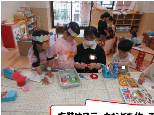
衣装やステッキなどを作って、ごっこ遊びをしています。