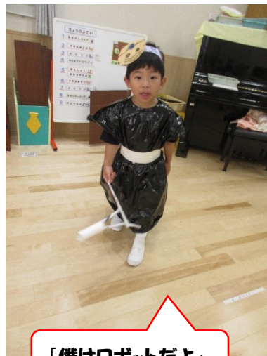
「僕はロボットだよ」