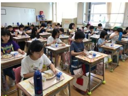
前を向いて静かに喫食