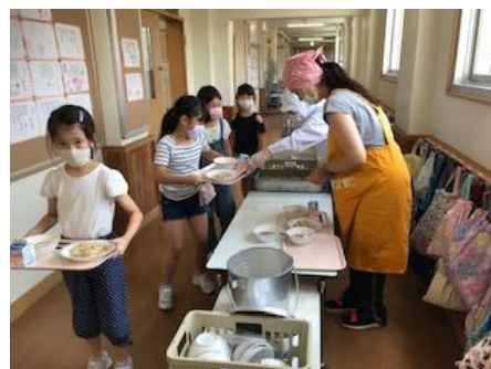
教職員(2人)だけで配膳