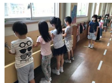
休み時間後は、必ず手洗い