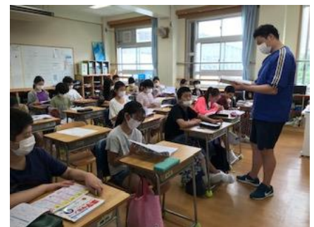
子供も先生もマスクをしての授業