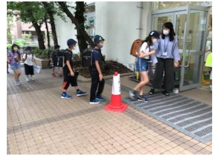
距離をとりながらの登校

現在、今後の教育活動の見直しをしているところですが、授業時数の確保に追われるだけでなく、子供たちにとって「明日も行きたい」と思える楽しい学校生活を実現させていくことを大切にしていきたいと思っています。