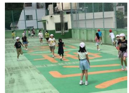
屋上を使い分散して遊ぶ中休み