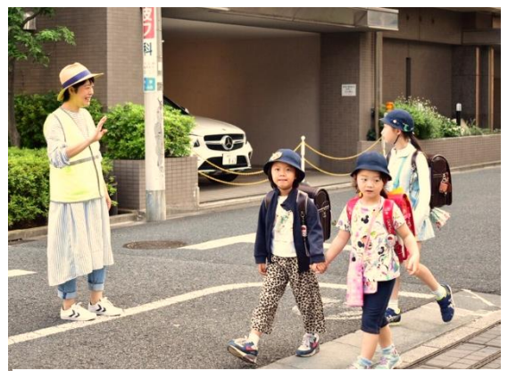
温かい声をかけてくださっています