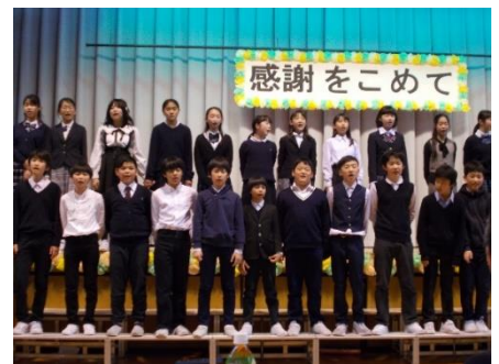
感謝の気持ちをこめて合唱する6年生

さて、先月25日に謝恩会がありました。新型コロナウイルスの影響のため、アルコール消毒をするなどの予防対策をした上での開催となりました。この日のために卒業対策委員の保護者の皆様をはじめ、たくさんの方々が準備をしてくださいました。心のこもった飾り付けなどの中、思い出の劇、教職員の歌など、子供たちにとって心に残る会となりました。この日にかける保護者の方々の思いを考えると開催できてよかったと心から思いました。