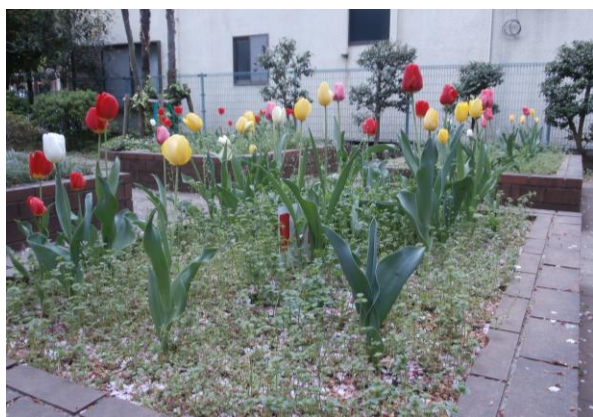
千駄木幼稚園の園児たちと一緒に植えた チューリップが咲きました。

17日(火) 区学力調査(1年) 全国学力調査(3年) 18日(水) 避難訓練 20日(金) ～21日(土) 学校防災宿泊体験(2年) 23日(月) 学年朝礼 24日(火) 内科検診(1, 2年) 25日(水) 一斉委員会 29日(日) 昭和の日 30日(月) 振替休日