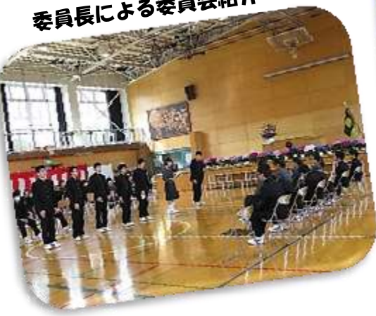
委員長による委員会紹介