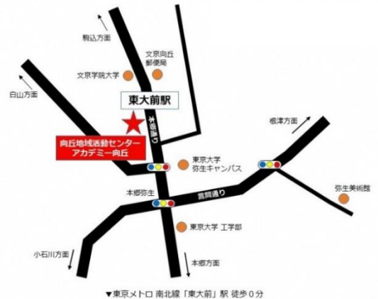
文京区立 向丘地域活動センター（アカデミー向丘 併設） 案内図