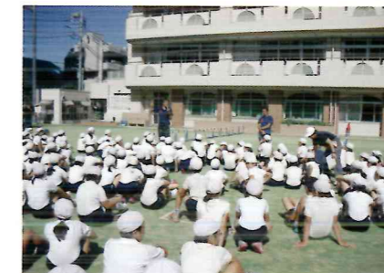
オリンピック・パラリンピック教育推進校