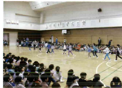
一年生を迎える会