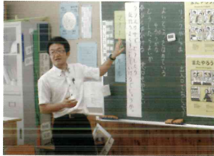
校内研究の推進(道徳授業)