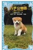
『ハチ公物語』 岩貞るみ子 講談社