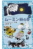
『ムーミン谷の冬』 トベ・ヤツリ 講談社