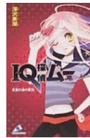
『IQ 探偵ムー ⑥』 深沢美潮 ポプラ社