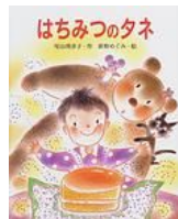
『はちみつのだね』 尾山理津子 ポプラ社