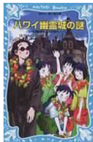
『ハワイ幽霊城の謎』 はやみねかおる 講談社