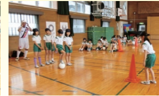
ブラインドサッカー