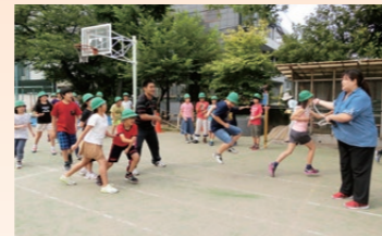
大縄チャレンジ（月1回）