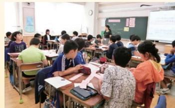
規範意識と自尊心を高める道徳の授業